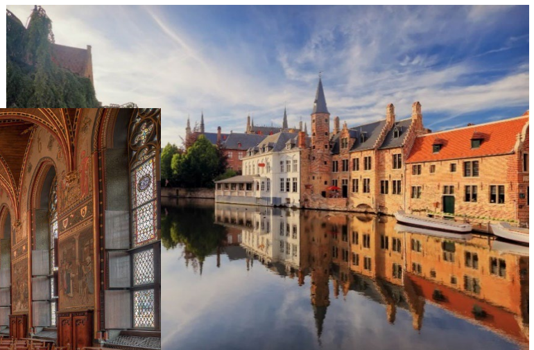
Altstadt von Brügge.